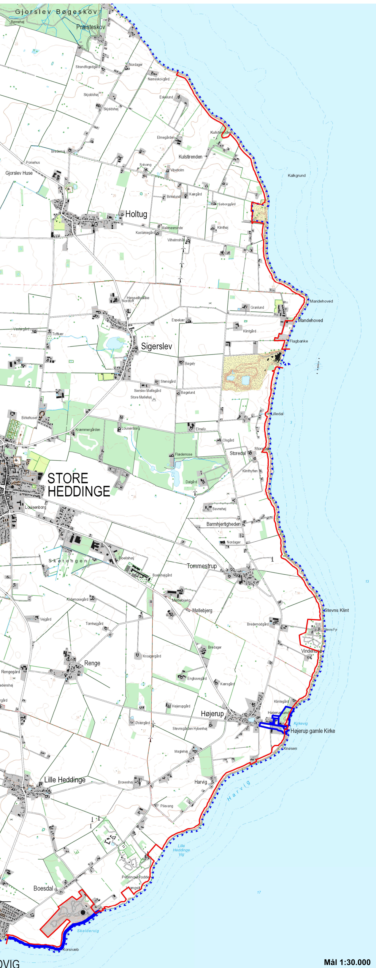
Kortbilag 1 nord

Fredningskort til MILJØ- OG FØDEVAREKLAGENÆVNETS Fredningsafgørelse af Januar 2021 Sagsnr. 18/05549