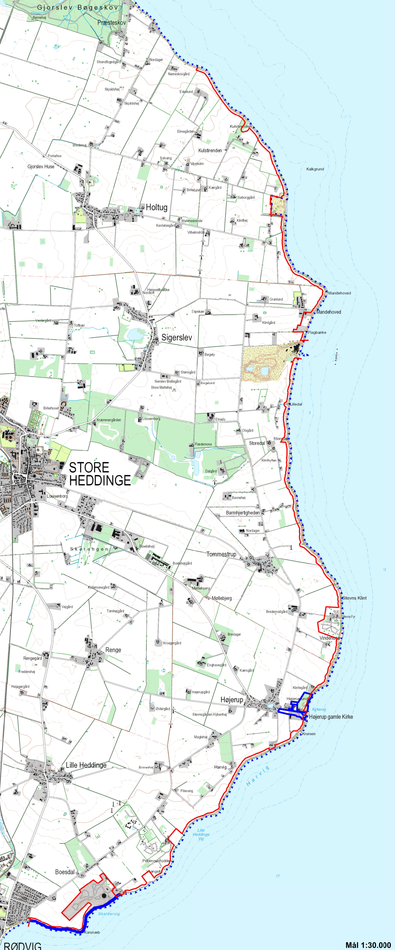
RØD VIG Ny fredningsgrænse Eksisterende fredninger Natura 2000