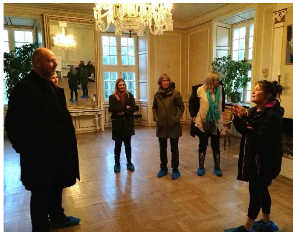
Fællesmøder holdes i Festsalen på Svanholm Gods

Herfra gik turen til landbrugskollektivet Svanholm . Her bor ca. 80 voksne og 50 børn på Svanholm Gods i Hornsherred. Godset blev købt i 1978 og Danmarks største kollektiv med fællesøkonomi blev dannet. Alle indtægter fra beboernes løn og fra egne erhvervsvirksomheder indgår i kollektivets fælles kasse. Kollektivet betaler så skat, husleje, kost m.m. for beboerne. Desuden udbetales et rådighedsbeløb til hver enkelt, 18,2% af personens bruttoløn. Svanholm-kollektivet var en af pionererne inden for økologisk landbrug i Danmark og stedet forsøger at have en økologisk synsvinkel på alle sine aktiviteter. Her var fællesskabslivet med egen produktion og butikker, deletransport (delecykler og deleheste) delevarer/værktøj et væsentligt aktiv. Deleøkonomier er en god tanke hvad angår transportmidler og det kunne være en god idé at tænke ind i nye boligområder. Beslutningsprocesserne ved fællesmøder var spændende - man skal ikke stemmes ud i sit eget hjem – hvilket Stevns Verdensmål har fundet stor inspiration i og siden har arbejdet med at beslutte enstemmigt.