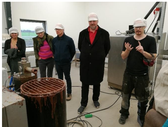
Rundvisning på chokoladefabrikken

Chokoladefabrikken havde en publikumsvenlig indretning og var velegnet til undervisning, hvilket er værd at have med i tankerne ved udvikling af et gammelt erhvervsområde som skal fornyes.