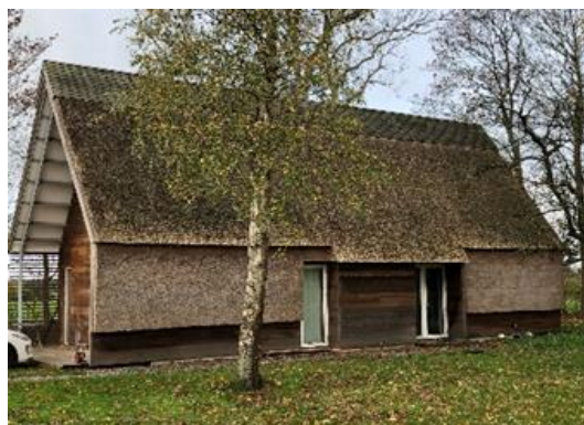
Det åndbare hus

Ekskursionen indbefattede 7 besøg og startede hos ” Egen Vinding og datter ” nær Ringsted, som havde udviklet ”Det åndbare hus”, der er et testhus støttet af Realdania. Målet var at dokumentere, at der kan skabes et godt indeklima og samtidig sikre en meget lav belastning af miljø og ressourcer. Huset er opført ved brug af miljøvenlige og bæredygtige materialer, eks. ler mursten, hvor leret hertil var hentet lokalt inden for 500m. Udvalget fik en rundvisning i virksomhedens produktion af nye natur- og miljøvenlige byggemetoder og -produkter. Det inspirerede til at tænke i alternative materialer, ny teknologi og at der skal udvikles genbrugsbygge-firmaer.