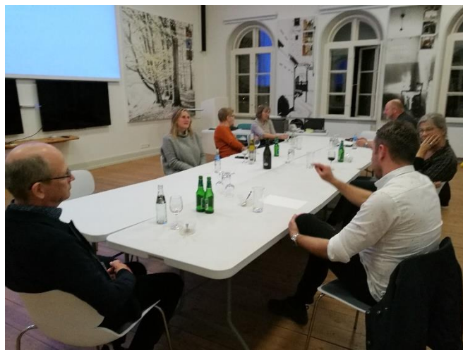
Evaluering af arbejdet i Stevns Verdensmål

Det har været et interessant, men også et meget udfordrende forløb. FN's verdensmål er et Spændende, men også meget komplekst emne for et midlertidigt udvalg, og det har krævet en noget stram styring at få indsnævret og præciseret udvalgets arbejdsområde. Udvalget har været meget ambitiøst og sat sig store mål for egen indsats. Medlemmerne i Udvalget havde meget forskellige udgangspunkter, interesser og kompetencer. Det har givet mange gode drøftelser, men har også fordret en gennemarbejdet dagsorden og facilitering af møderne og en stram styring af tiden. Ekskursionen i efteråret 2019 satte arbejdet i gang og gav et stærkt fundament for udvalgets og dets efterfølgende arbejde.