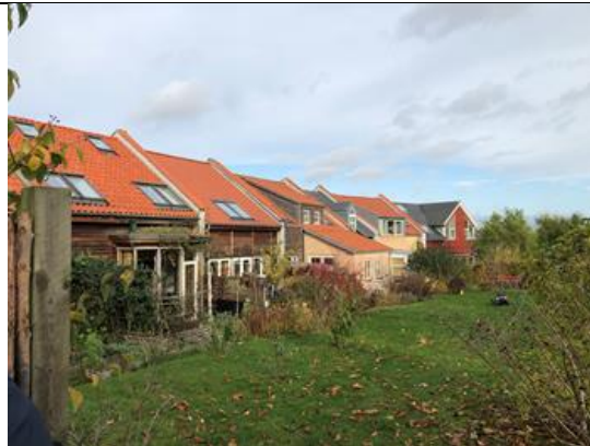
Rækkehuse i Dyssekilde

Herfra gik turen til landbrugskollektivet Svanholm . Her bor ca. 80 voksne og 50 børn på Svanholm Gods i Hornsherred. Godset blev købt i 1978 og Danmarks største kollektiv med fællesøkonomi blev dannet. Alle indtægter fra beboernes løn og fra egne erhvervsvirksomheder indgår i kollektivets fælles kasse. Kollektivet betaler så skat, husleje, kost m.m. for beboerne. Desuden udbetales et rådighedsbeløb til hver enkelt, 18,2% af personens bruttoløn. Svanholm-kollektivet var en af pionererne inden for økologisk landbrug i Danmark og stedet forsøger at have en økologisk synsvinkel på alle sine aktiviteter. Her var fællesskabslivet med egen produktion og butikker, deletransport (delecykler og deleheste) delevarer/værktøj et væsentligt aktiv. Deleøkonomier er en god tanke hvad angår transportmidler og det kunne være en god idé at tænke ind i nye boligområder. Beslutningsprocesserne ved fællesmøder var spændende - man skal ikke stemmes ud i sit eget hjem – hvilket Stevns Verdensmål har fundet stor inspiration i og siden har arbejdet med at beslutte enstemmigt.