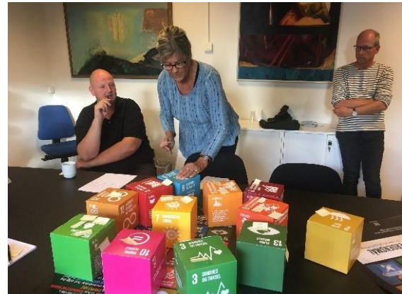
Gruppearbejde i Stevns Verdensmål