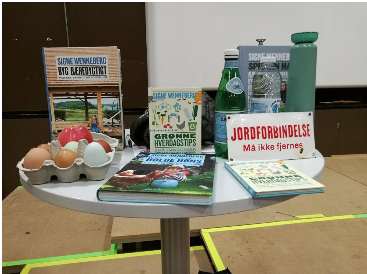
Gør Verdensmål til hverdagsmål – fra debatten på Inspirationsdagen den 12. sept. 2020