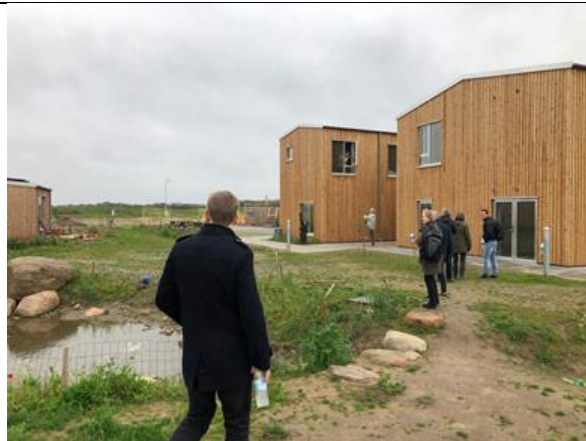
Skråningen i Lejre

Eco-Village, havde stået for konceptet, så folk kendte ikke nødvendigvis hinanden før de flyttede ind. Eco-Village udvikler bofællesskaber og økologiske landsbyer. Af de bofællesskaber som var indeholdt i ekskursionen, appellerer dette nok bredest ud og det så ud som om det udviklede sig stille og roligt. Dette er et koncept Stevns Kommune kan bruge, da det henvender sig til de mange og ser ud som den mest farbare vej. Gode udendørsarealer med vandløb og fælles blomsterenge som fællesarealer. Fællesspisning er en god ting, som også kunne være drivkraft i forsamlingshusene – som en generator i landsbyerne i Stevns Kommune.